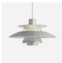
PH 5 Retake