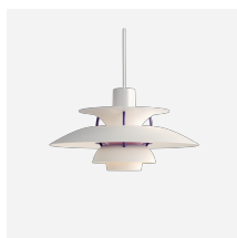
PH 5 Mini